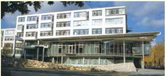
»Haus des Landkreises«, Ulm

Einweihung des neuen „ Haus des Landkreises “, Schillerstraße, Ulm: Sitz der Kreisverwaltung und Tagungsort des Kreistages.