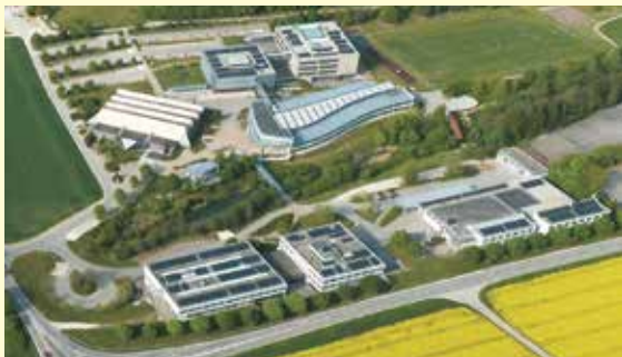
Berufliches Schulzentrum, Ehingen

Die Gewerbliche Schule ist mit Fertigstellung des Theoriegebäudes komplett am neuen Standort am Stadtrand in Ehingen.