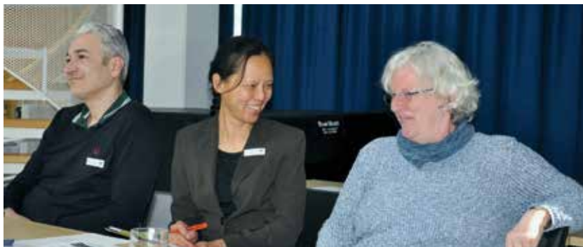
Fachpublikum bei der Fortbildungsveranstaltung für Heim- und Pflegedienstleitungen.