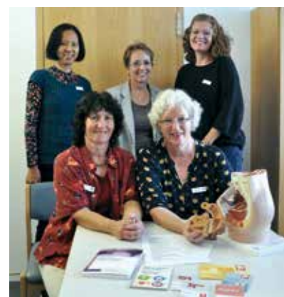
Das Team der Ärztinnen für die gesundheitliche Beratung der Prostituierten.

Die gesundheitliche Beratung wird seit 1. November 2017 im Fachdienst Gesundheit durchgeführt. Bisher haben 200 Personen (197 Frauen und drei Männer) die Beratung in Anspruch genommen. Der größte Teil der Personen kommt aus Rumänien, gefolgt von Deutschland und Ungarn; ansonsten stammen die Frauen aus ganz unterschiedlichen Ländern,