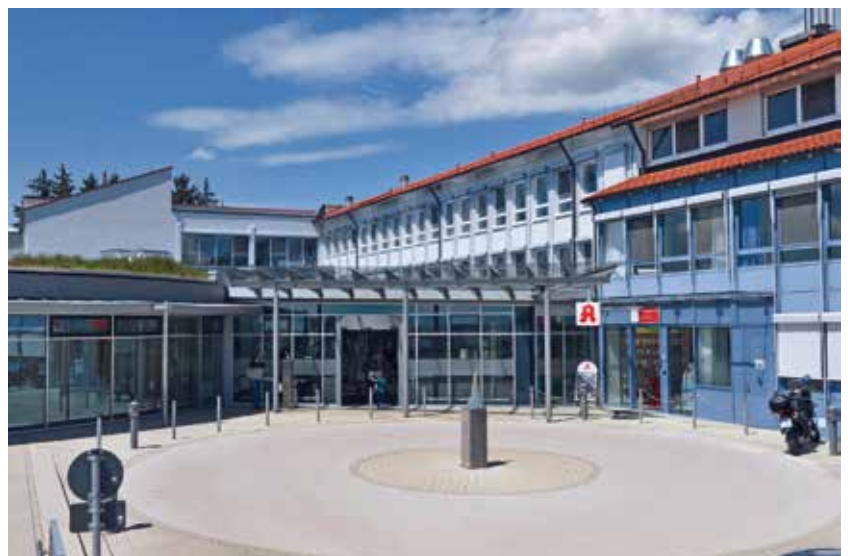
Gesundheitszentrum Langenau – ein Standort des Alb-Donau Klinikums. Die Kreiskliniken sind der größte Investitionsschwerpunkt im Kreishaushalt.