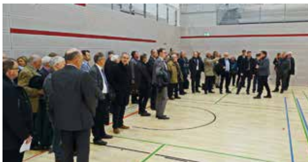
Kreisrätinnen und Kreisräte besichtigen die neue Sporthalle beim Ehinger Johann-Vanotti-Gymnasium. Hier haben auch Schülerinnen und Schüler der Kaufmännischen Schule des Landkreises Sportunterricht.

Bericht über die Schulen im Alb-Donau-Kreis durch das Staatliche Schulamt Biberach sowie über die Bildungsregion Alb-Donau-Kreis (KT, 22.10.18)