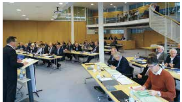
Kreistagssitzung im Haus des Landkreises.

Neufassung der Hauptsatzung des Alb-Donau-Kreises (KT, 16.07.18)