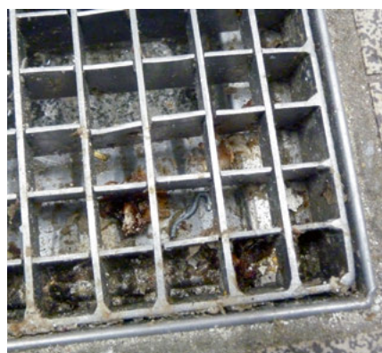
Stark verunreinigter Bodenablauf in einem Lebensmittelbetrieb

Aktuell sind 10 Lebensmittelkontrolleurinnen und -kontrolleure in der Lebensmittelüberwachung im Alb-Donau-Kreis tätig. Für das Jahr 2024 ist die Ausbildung zwei weiterer Lebensmittelkontrolleure geplant.