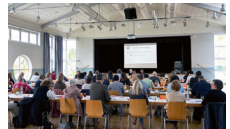
Frühjahrsschulung am 26. April 2023 im Bürgerhaus in Dietenheim-Regglisweiler

trafen sich dazu im April 2023 in Dietenheim-Regglisweiler sowie im Mai 2023 in Westerheim.