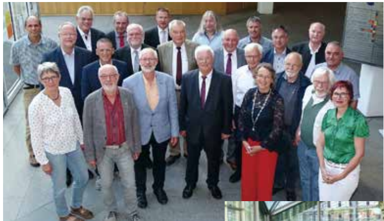
Abschied vom Gremium: Die ausgeschiedenen Kreistagsmitglieder.

Die Kreisrätinnen und Kreisräte erhielten neben einer Urkunde ein Weinpräsent sowie einen Obstbaum.