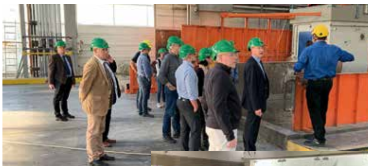
Der neu gewählte Kreistag besuchte unter anderem das Müllheizkraftwerk Ulm-Donautal und die Gewerbliche Schule des Landkreises in Ehingen.

An drei Tagen wurden die drei Kreiskrankenhäuser, die beruflichen Schulen und weitere Einrichtungen und Liegenschaften der Schulverwaltung, der Abfallwirtschaft und des Sozialdezernates besucht. Insgesamt wurden an drei Tagen insgesamt 19 Einrichtungen besucht.