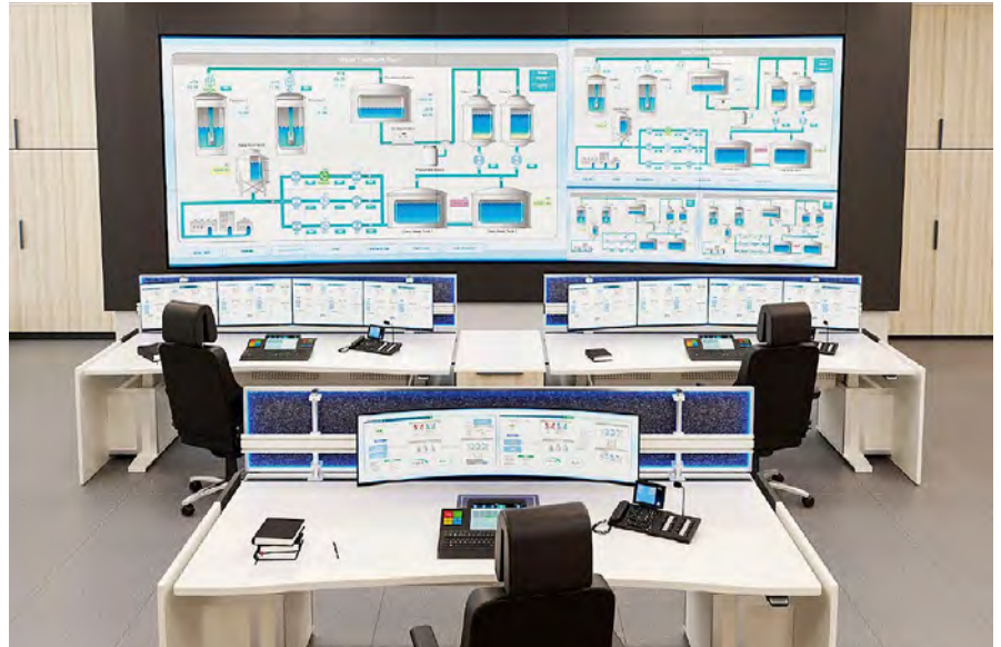
Die neue Leitwarte (Computersimulation)

Um 169.000 Tonnen Abfälle im Jahr thermisch entsorgen zu können, müssen beide Verbrennungslinien durchweg störungsfrei betrieben werden können. Das gelingt nur durch regelmäßige Wartung und vorbeugende Instandhaltung der Anlage. Deshalb wurden 2021 drei geplante Revisionen durchgeführt – teilweise mit großem Aufwand: Der Rauchgas/Rauchgas-Wärmetauscher musste beispielsweise aufgrund der Größe und des Gewichts durch einen Kran über das geöffnete Dach des MHKWs an die Einbaustelle befördert werden. Im Oktober fand die Revision der Turbine statt, bei der die Turbinensteuerung und die gesamte Messinstrumentierung erneuert wurde.