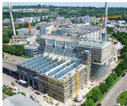
Bunkererweiterung Stand Juni 2021

Die Erweiterung des MHKW ist fast abgeschlossen: Im Januar 2021 konnte die Bodenplatte der Entladehalle betoniert werden. Trotz vorübergehender Einstellung der Bauarbeiten wegen Minustemperaturen wurden bis April 2021 die Wände am Bunkerrohr und die Decke der ersten Geschoßebene der Entladehalle fertig gebaut. Somit waren die Betonierarbeiten abgeschlossen.