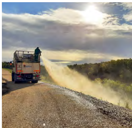
Nassansaat zur Rekultivierung der Deponie

solche, daher hatte die Maßnahme nur geringe natur- und artenschutzrechtliche Auswirkungen. Als ökologischer Ausgleich entstanden aber am nordöstlichen Deponierand in Richtung des bestehenden Biotops und Naturdenkmals Ersatzhabitate und Ersatzlaichgewässer zum Schutz von Zauneidechse und Kreuzkröte.