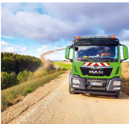
Rekultivierung der Deponie Grund