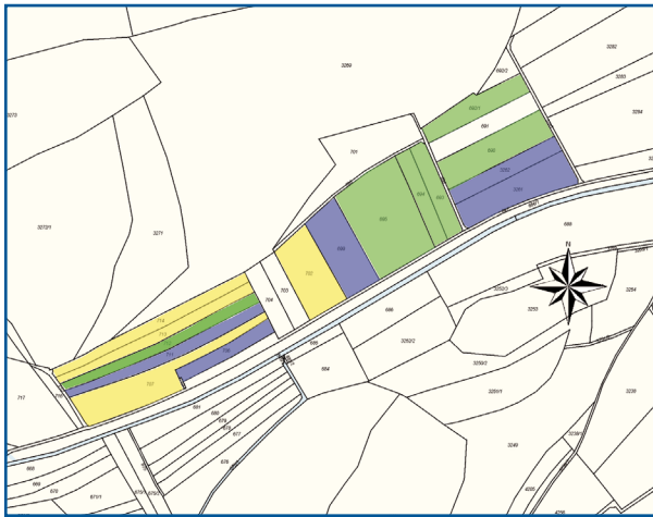
Vor dem Landtausch ▲