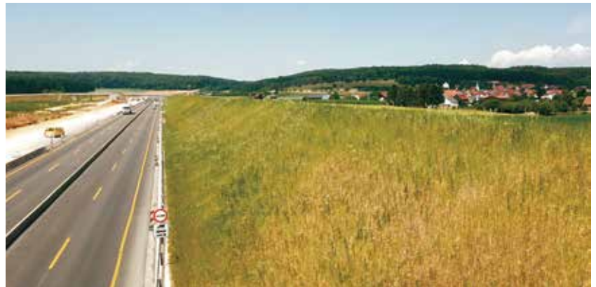
Neu angelegter Lärmschutzwall entlang der Autobahn A8.

menarbeit mit dem Vorstand der Teilnehmergeinschaften und den betroffenen Gemeinden aufgestellt. Der Rohentwurf des Wege- und Gewässerplanes wird dann mit den Unternehmensträgern und allen beteiligten Trägern öffentlicher Belange abgestimmt.