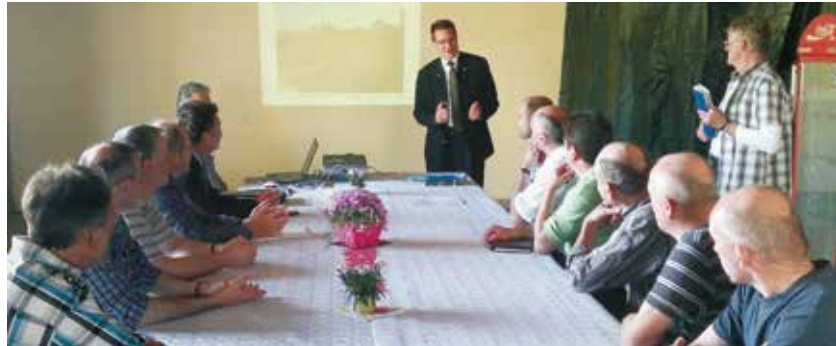
Die Vorsitzenden der Teilnehmergeinschaften im Gespräch mit dem stellvertretenden Landrat Heiner Scheffold – bei ihrem Treffen in Staig.

Die Gemeinde Staig möchte das Flüsschen Weihung renaturieren. Die Renaturierung benötigt viel Fläche und hat auch Auswirkungen auf die Anlieger, das Wegenetz und die Landwirtschaft. Um alle Interessen zu bündeln und mögliche Konflikte schon im Vorfeld zu lösen, wurde eine Flurneuordnung als Moderations- und Planungsver-