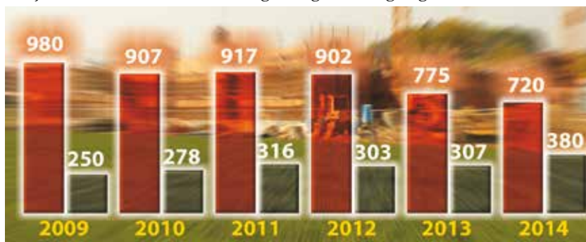
Entwicklung der Baugenehmigungs- und Kenntnisgabeverfahren (Die Zahlen für das Jahr 2014 sind hochgerechnet)

Kenntnisgabeverfahren. Da das Kenntnisgabeverfahren das kos-tengünstigere Verfahren ist, spie-gelt sich diese Entwicklung in der Gebühreneinnahme für das Jahr 2014 wieder. Für das Jahr 2014 werden vermutlich 1,1 Millio-nen Euro erreicht (2013: 1,2 Millionen Euro).