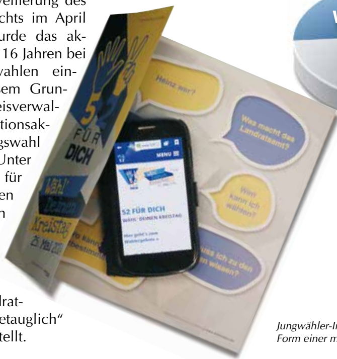
Jungwähler-Information zur Kreistagswahl – in Form einer mobilen Webseite für Smartphones.