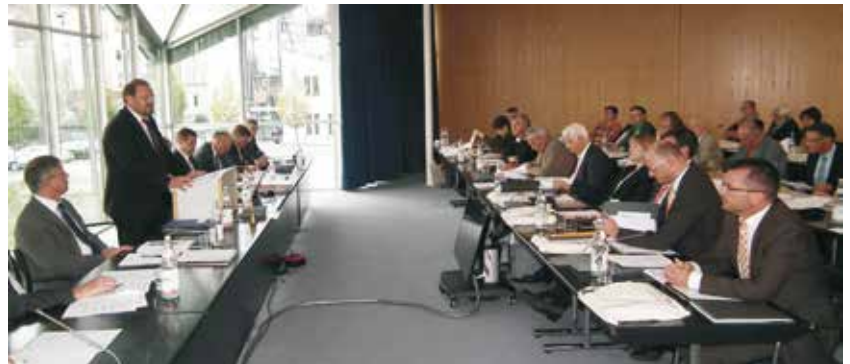
Sitzung des Kreistages.