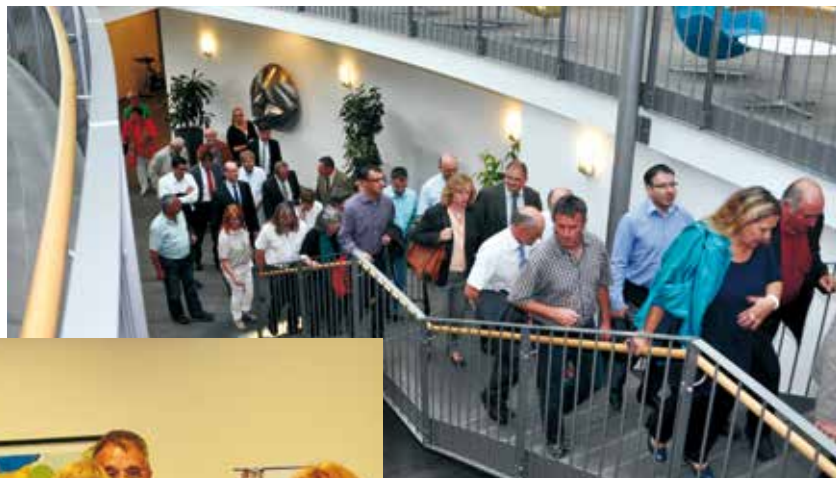
Kreisrätinnen und Kreisräte besuchen die Kliniken des Landkreises.

Rundgängen vorgestellt. Insgesamt wurden an drei Tagen 21 Einrichtungen besucht.