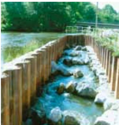
Wehranlage mit „Fischpass“ und Ausleitungskanal zum EnBW-Kraftwerk.