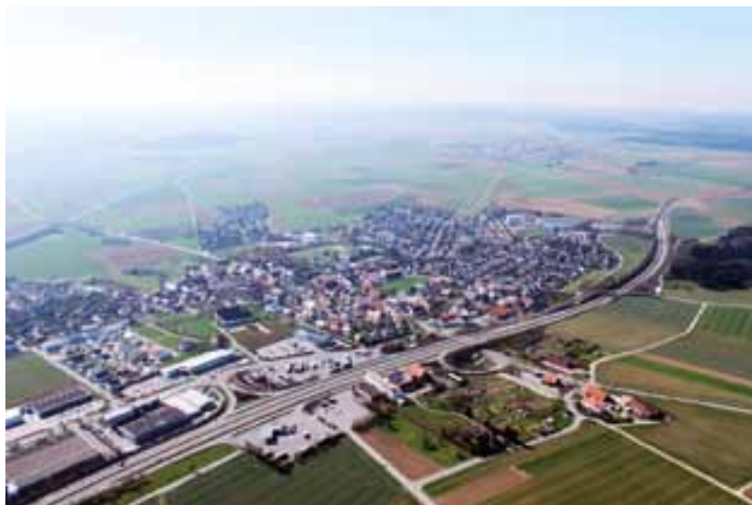
Erfolgreiche Gewerbeansiedlungen wie im Bereich Dornstadt.

Erneut ist positiv zu werten, dass der Umfang der Beschäftigten ohne abgeschlossene Ausbildung in den letzten Jah-