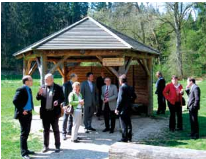
Leader Aktionsgruppe am Grillplatz Fohlenhaus im Lonetal.

Projektbeispiele zum Erhalt der dörflichen Infrastruktur sind im gewerblichen Bereich die