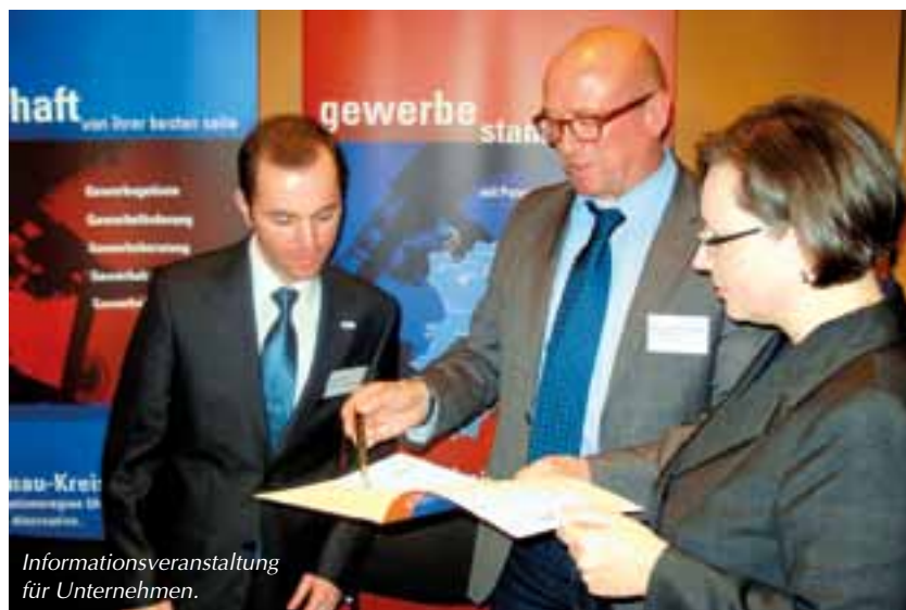
Informationsveranstaltung für Unternehmen.

Von diesem nachhaltigen Konzept erhofft sich der Raum Munderkingen einen weiteren Schub in Richtung „Ausbau Tourismus“.