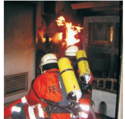
Angriffstrupp bei der Brandbekämpfung im Container

aktive Feuerwehrangehörige aus dem Landkreis wurden von den Kreisausbildern in der Vorgehensweise eines Einsatzes geschult. Der von der EnBW gestiftete Brandcontainer sorgt für eine wirklichkeitsnahe Simulation von Bränden und Löscheinsätzen.