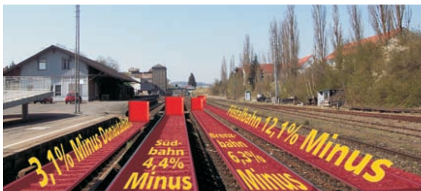
Kürzung der Angebotsleistungen im SPNV zum 10. Juni und zum 9. Dezember 2007

Trotz steigender Kosten ist es der Landkreisverwaltung gelungen die Eigenanteile in der Schülerbeförderung, die Eltern für die Monatskarten ihrer Kinder zahlen, im Jahr 2007 auf dem landesweit niedrigsten Level zu halten.