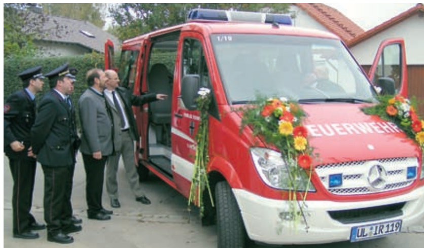
Fahrzeugübergabe in Illerrieden

In diesem Jahr konnten mehrere bezuschusste Fahrzeuge an Feuerwehren in Blaubeuren (Ortsteil Beinigen), Ehingen, Erbach, Illerrieden und Munderkingen übergeben werden