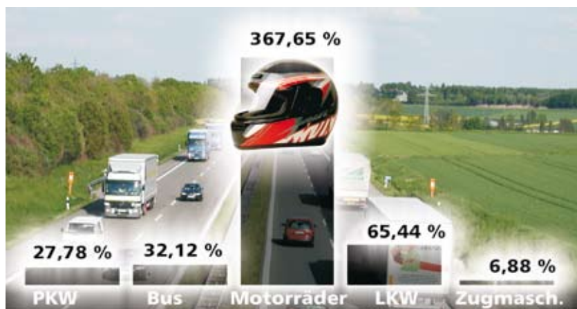
Prozentuale Zunahme des Fahrzeugaufkommens im Alb-Donau-Kreis von 1992 bis 2006

die Anzahl der Krafträder vierfache. Die Zunahme von Lastkraftwagen um satte 65 Prozent ist teilweise auch ein Spiegel der wachsenden Wirtschaftskraft des Alb-Donau-Kreises.