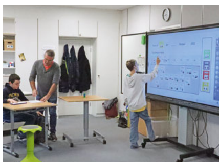
Unterricht in der Außenstelle (Foto: Landratsamt Alb-Donau-Kreis / Daniela Baumann)

deutlichen Zuwachs. Um ausreichend Platz zum Lernen zur Verfügung zu stellen, wurde daher zu Beginn des Schuljahres 2023/2024 ein weiteres Stockwerk im Business Park angemietet.