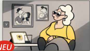
Einfach machen! Tablets & Co. bei Demenz