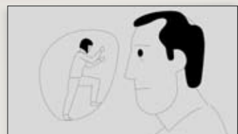
Durch den Nebel