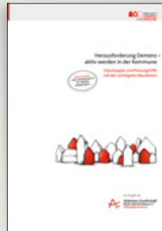
Herausforderung Demenz – aktiv werden in der Kommune. Impulspapier und Planungshilfe