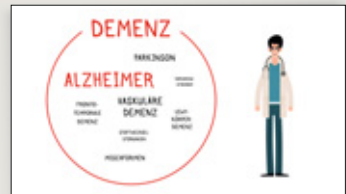
Vergesslichkeit oder Demenz?