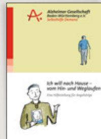
Ich will nach Hause – vom Hin- und Weg- laufen. Eine Hilfestel- lung für Angehörige