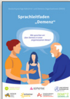
Sprachleitfaden »Demenz« – angemessen über Demenz sprechen

Infomaterial bestellen Sie am einfachsten über unsere Website → www.alzheimer-bw.de/infoservice , alternativ auch telefonisch oder per Mail.