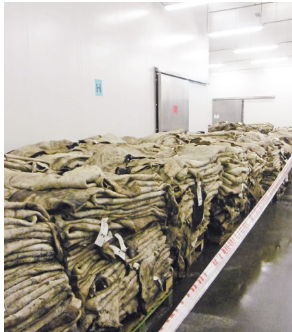
Rohe gesalzene Rinderhäute zur Lederherstellung

Im Alb-Donau-Kreis wurde im Jahr 2021 ein genehmigungspflichtiger Betrieb zur gekühlten Zwischenlagerung von Unterspaltmaterial zur Abgabe an Hersteller von Lebensmittelgelatine und -kollagen eröffnet. Das Unterspaltmaterial wird in der Gerberei aus Rinderhäuten gewonnen und stellt die dünne, kollagenhaltige Schicht zwischen der oberen und unteren Hautschicht dar. In der Gelatine- und Kollagenherstellung wird Rinderspalt als proteinhaltiger Rohstoff neben Schweineschwarten und Knochen verwendet.