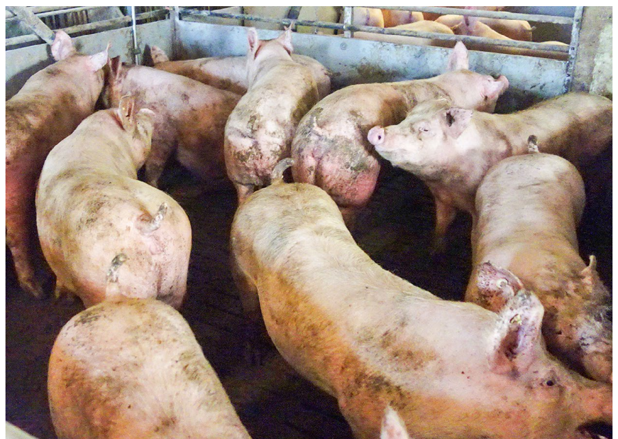
Tierschutzwidrige Zustände: Überbelegter, verschmutzter Stall

Zudem folgten weitere engmaschige Kontrollen, die im Verlauf der folgenden Wochen und Monate eine klare Verbesserung der Situation zeigten. Bei diesen andauernden Kontrollen spielt neben der Umsetzung der verfügbaren Maßnahmen auch die fachliche Begleitung des Betriebes eine große Rolle, die neben der Verbesserung der Haltungsumstände und tierschutzkonforme Zustände auch auf eine Reduktion beziehungsweise Abgabe des Tierbestandes zielt.